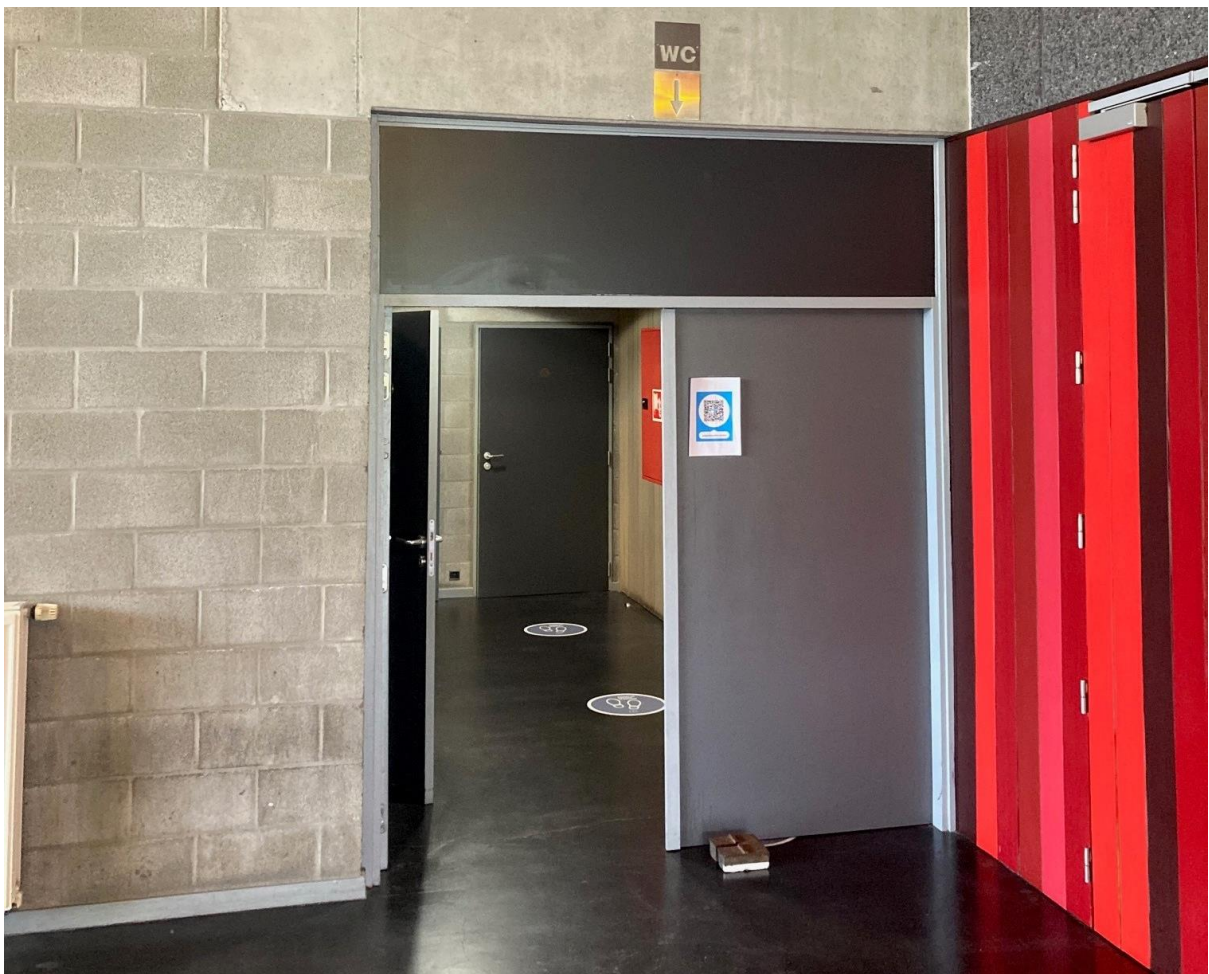
De toiletten bevinden zich links voor de ingang van de theaterzaal. Er is ook een toilet voor rolstoelgebruikers.