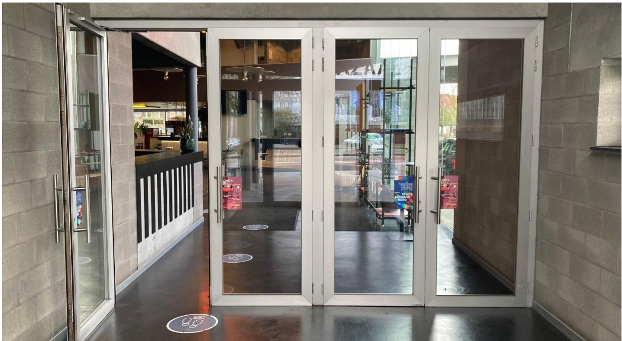
Na de inkomhal, heb je links de ticketbalie en de vestiaire.