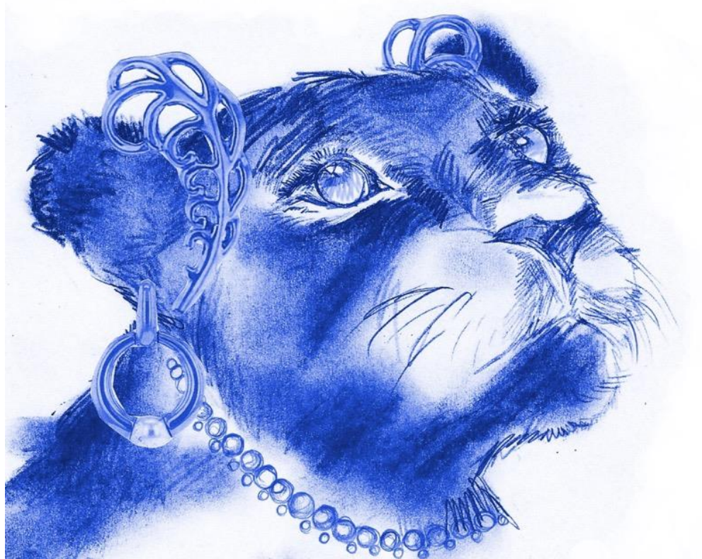
Tekeningen: Aline Breucker

Je kan en mag doen wat je nodig hebt om je goed te voelen.