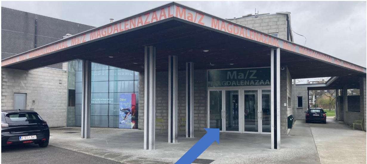
Dit is de ingang van de MaZ.