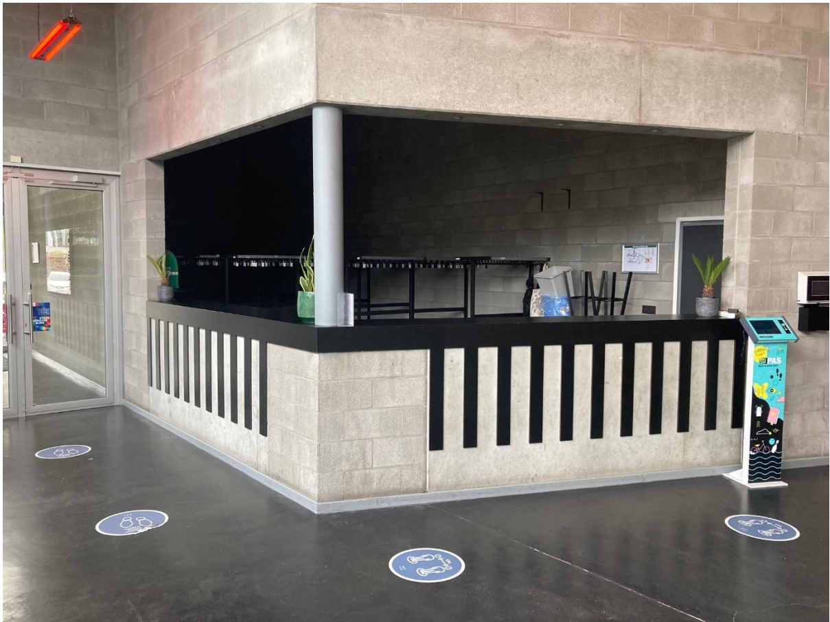
In de vestiaire kan je je jas veilig achterlaten.