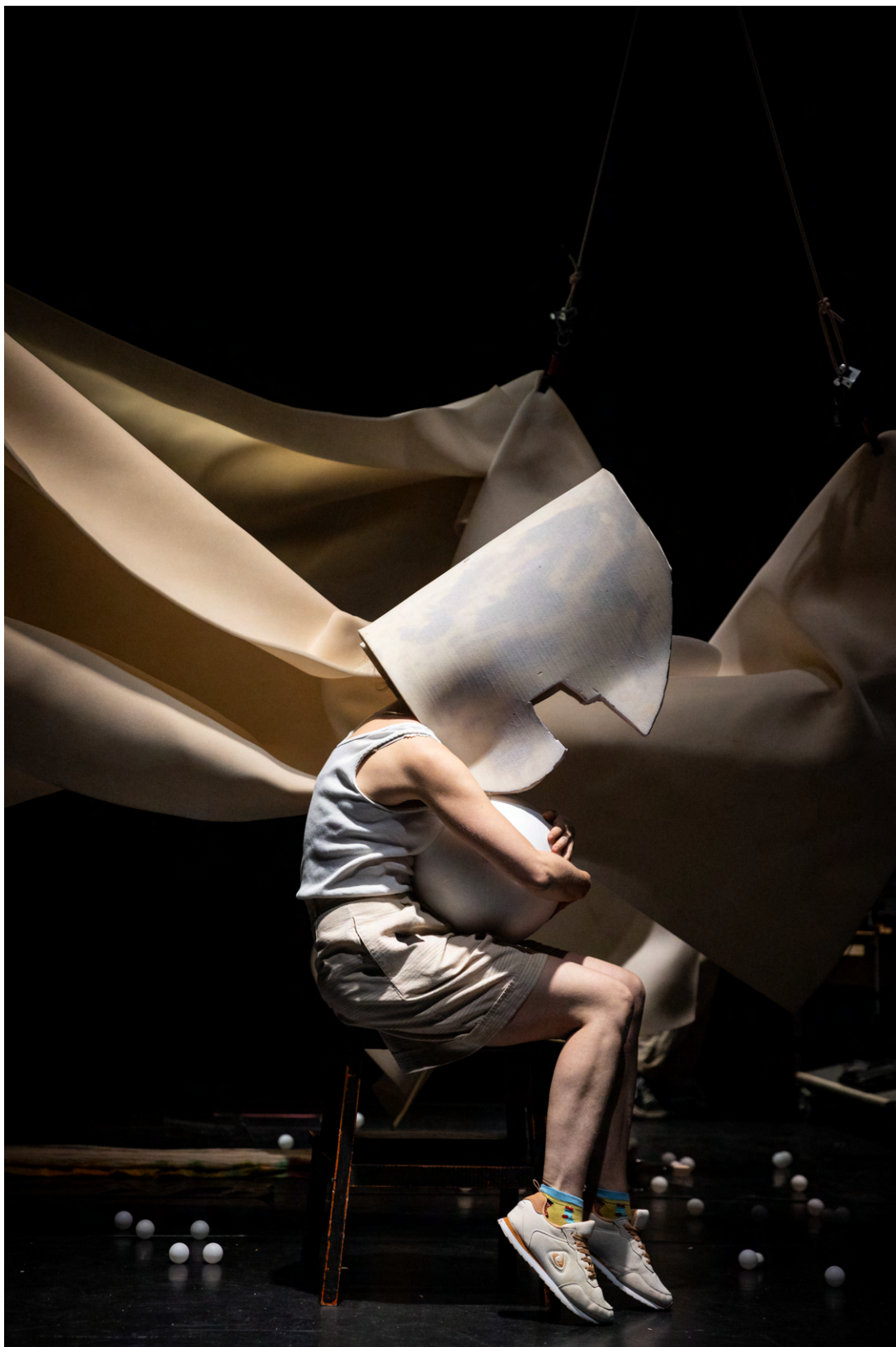
BEELD 1: een beeld uit de voorstelling.